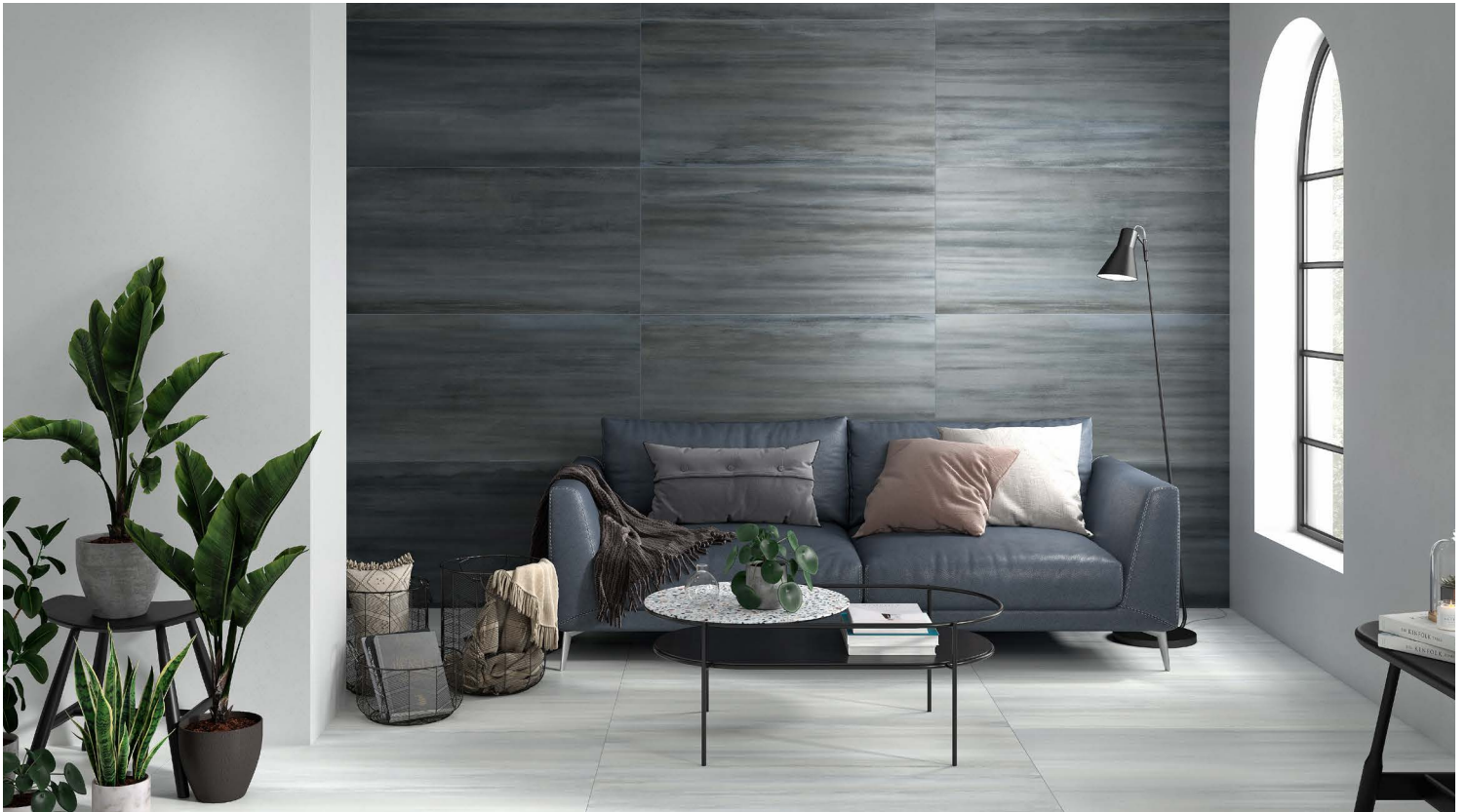
PETROL – mur ; PERLE - plancher