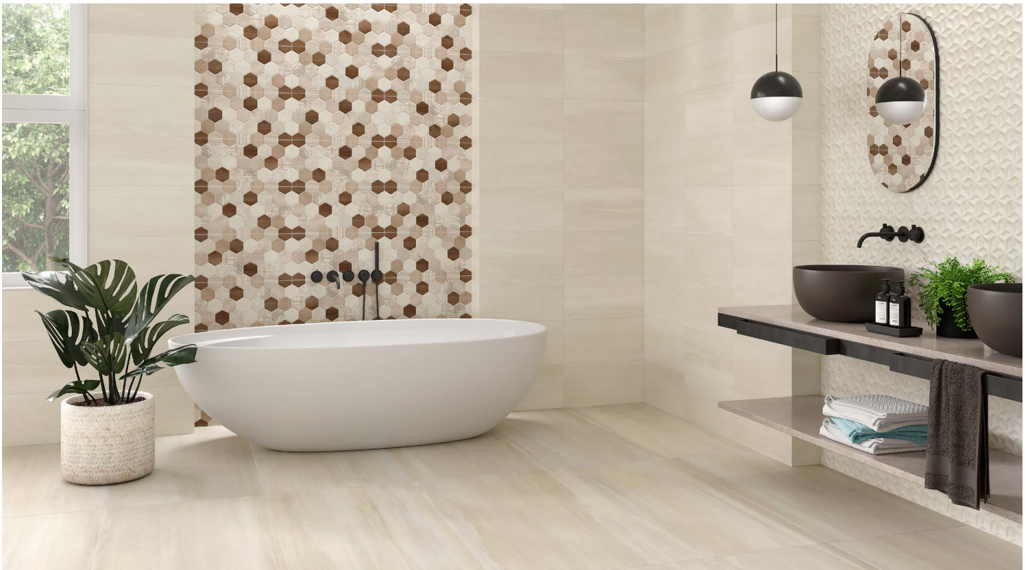
BEIGE PÂLE – mur et décor mur à droite; BEIGE - plancher