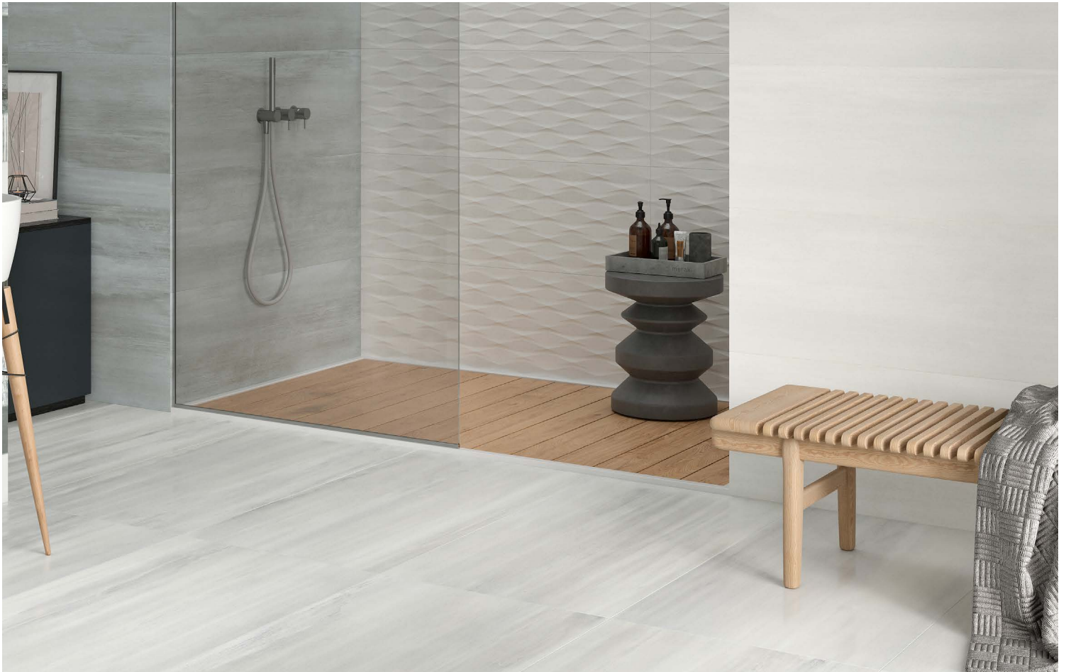
PERLE PÂLE – mur à droite; PETROL PÂLE – mur à gauche; PERLE – plancher